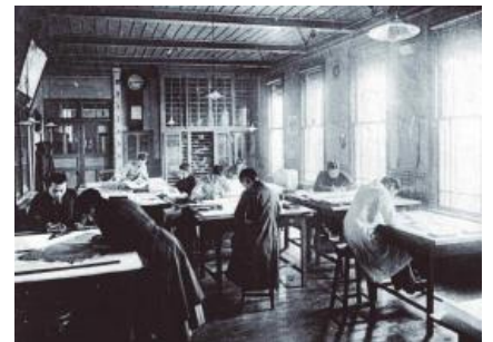
大正初期の製図場