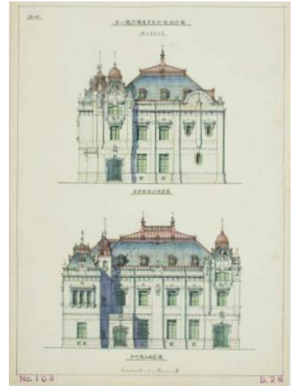
第一銀行横浜支店（第3巻所収）

東京キャリコ製織会社 東亜製粉会社工場 日清紡績会社（工場・第二工場・織機工場） 下野紡績船形分工場 東京紡績橋場工場 渋沢第倉庫（第一期～第三期） 茅場町渋沢増築倉庫 八十島邸倉庫 東京書籍会社工場 大日本図書会社倉庫 他