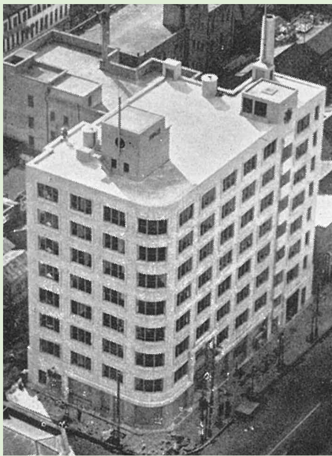
『電通社史』（迫大平編 日本電報通信社刊 1938年）より

経営学、経営史研究に最適な社史を厳選。財務データの集積ではこぼれ落ちてしまう、企業の歴史の裏までたどれるような社史を収録。