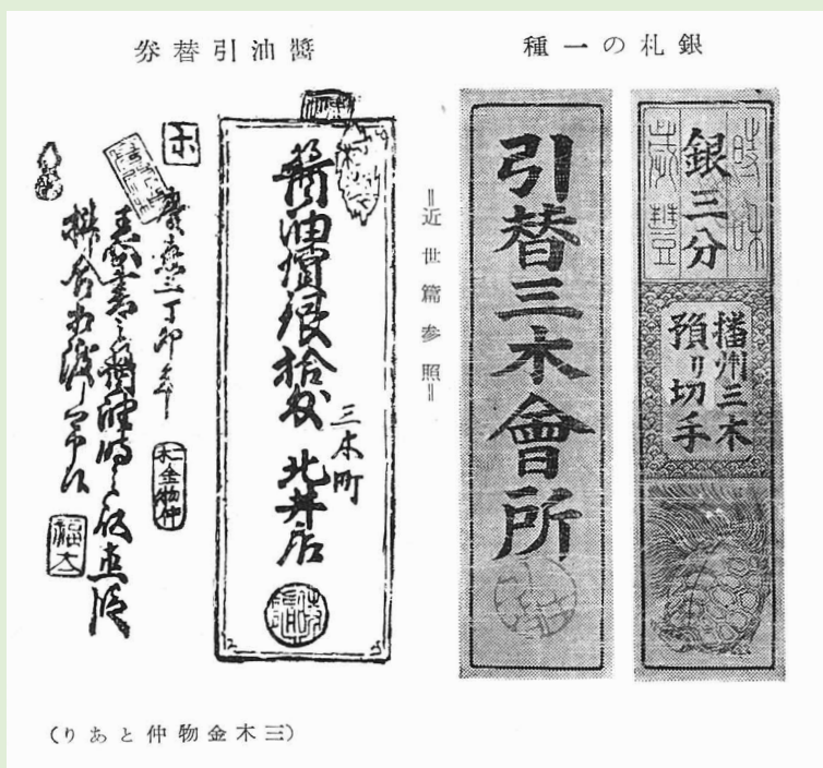
『三木金物誌』（小西勝治郎編著 三木金物誌刊行会刊 1953年）より