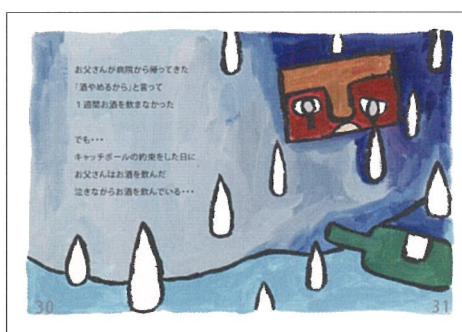
キャッチボールの約束をした日にお酒を飲んだ