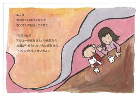
お酒がやめられないのは病気なの