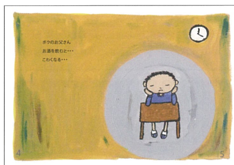
ボクのお父さん お酒を飲むとこわくなる