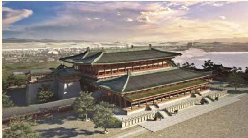
麟徳殿 (右「復元平面図」③)