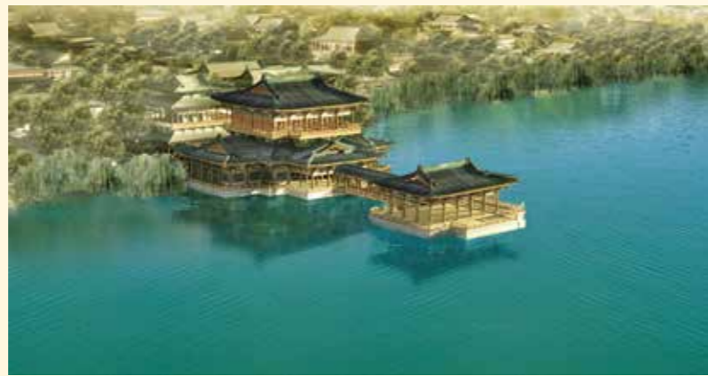
太液池 (右「復元平面図」②)

半世紀あまりにおよぶ唐長安城の考古学的調査は、大明宮を中心として進められてきた。本書はそれらの考古学的知見と諸文献の整理をふまえて、建築史・建築考古学の視点から、往時の大明宮のすがたを鮮やかに描きだす。