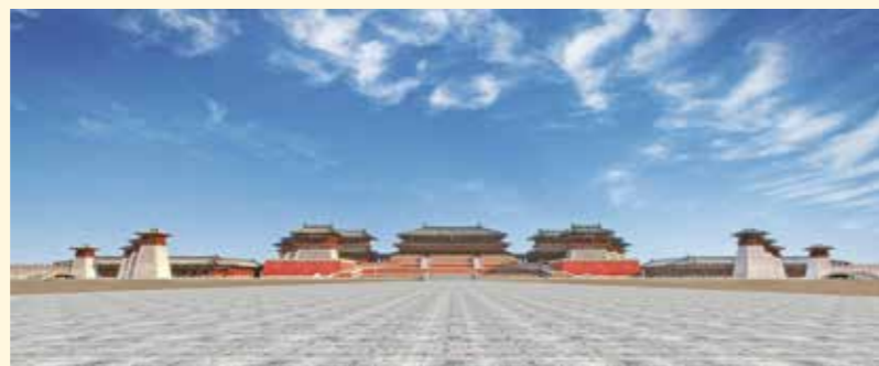
含元殿 (右「復元平面図」④)

近年の大明宮を含む唐長安城の考古学的発掘成果と歴史文献の記述を丹念に整理・検証した本書は、まさに大明宮の全容を明らかにした唯一の書。