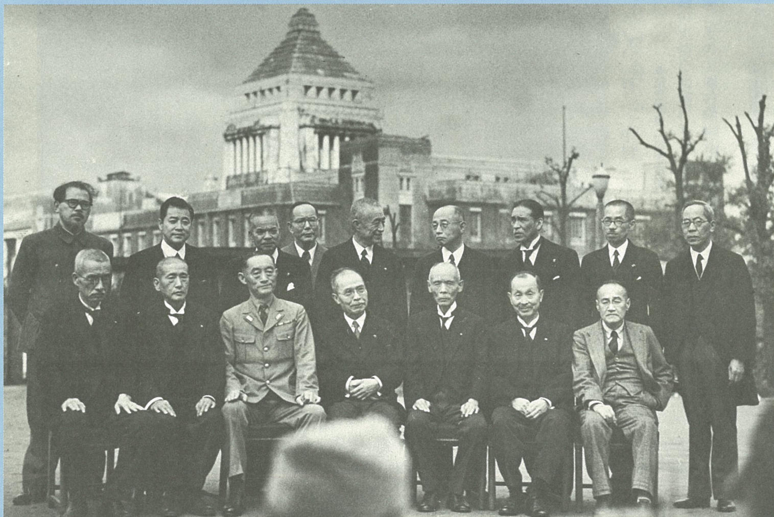
戦争調査会をつくった幣原内閣の初顔合わせ。中央が幣原喜重郎、前列右端が吉田茂外相、後列右から3番目が芦田均厚相。